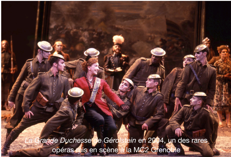
La Grande Duchesse de Gérolstein en 2004, un des rares opéras mis en scène à la MC2 Grenoble